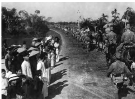
Forces japonaises se dirigeant vers Saïgon.

Cette politique expansionniste provoque, presque instantanément, les premières mesures de rétorsion américaines. La tension s'aggrave encore à la nouvelle de l'alliance du Japon avec l'Allemagne et l'Italie. À partir de ce moment, une crise sérieuse s'installe entre les deux pays et s'aggrave à chaque nouvelle avancée japonaise. À Washington qui comprend qu'il s'agit d'un plan japonais visant à s'emparer des colonies néerlandaises et britanniques, répond Tôkyô qui se voit conforté dans son désir d'obtenir les ressources qui lui font défaut. L'occupation de la totalité de la colonie française au mois de juillet 1941 rend le conflit inévitable. Malgré l'offensive allemande contre l'URSS, le Japon choisit le Pacifique comme terrain d'expansion et les États-Unis comme adversaire principal.