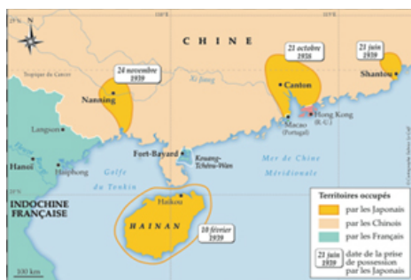
Zones occupées par les forces armées japonaises en Chine méridionale (1938-1939)

C'est l'armée allemande qui, à partir de mai 1940, ouvre la porte du sud au Japon en occupant les Pays-Bas, la France et en menaçant le Royaume-Uni d'une invasion. Confronté à une occasion inespérée, le Japon réoriente brutalement sa politique étrangère dans le sens d'une expansion aux dépens des puissances européennes en Asie du Sud-Est et en Océanie. Mais alors que la fuite du gouvernement néerlandais à Londres met les Indes orientales néerlandaises (l'actuelle Indonésie) sous la protection britannique, l'armistice séparé demandé par la France à l'Allemagne rend l'Indochine française vulnérable. Bien qu'ayant déjà tordu le bras de la France en la forçant à signer une série d'accords politiques et économiques ouvrant largement l'Indochine aux intérêts japonais, l'armée de terre japonaise viole, le 23 septembre 1940, la frontière indochinoise et obtient la soumission de la colonie. Il s'agit pour le Japon de faire montre de sa force et de sa résolution afin d'utiliser l'Indochine comme il l'entend, car celle-ci doit jouer le rôle de tremplin en cas d'offensive contre les puissances occidentales.