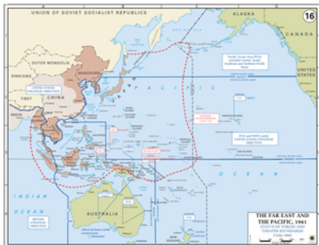
Zone occupée par l'armée japonaise au début de la Guerre du Pacifique (carte gracieusement fournie par le département d'histoire de l'académie militaire de West Point )

Source : Mainichi Shinbunsha, in Furuta Motoo, Shashin kiroku : Tônan Ajia, rekishi, sensô, Nihon , (Archives photographiques : Asie du Sud-Est, histoire, guerre, Japon), vol. 5, Harupu Shuppan, 1997. p. 80.